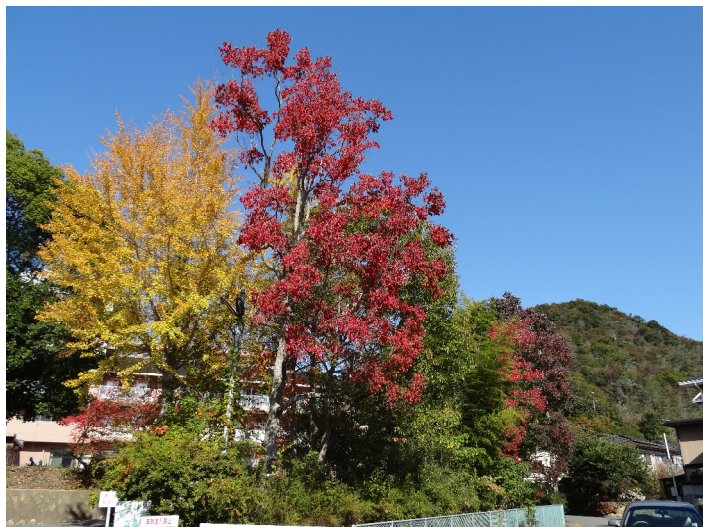
鶴林園の紅葉風景

臉を閉じると、そこに浮かんでくるのは親の姿ではないか。そう思うと、親から貰った遺伝子のためにも、もう少し頑張ってみようかと思う。