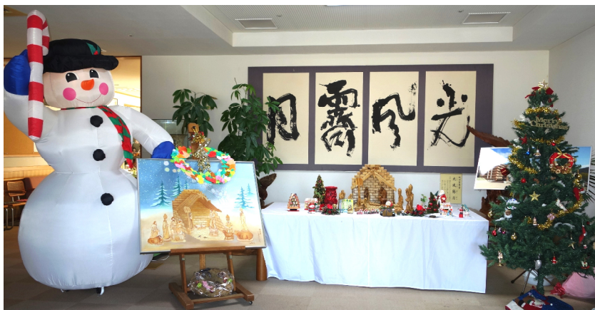
12月の鶴林園本館玄関