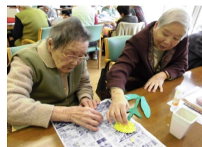
まずは タンポポを作成